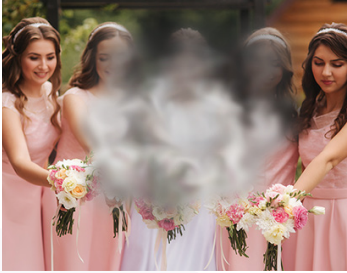
Visión de atrofia geográfica